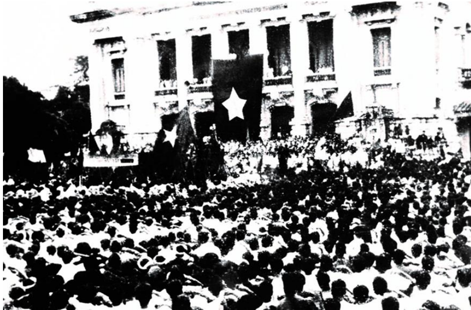
Cuộc mít tinh phát động khởi nghĩa giành chính quyền do Mặt trận Việt Minh tổ chức tại Nhà hát lớn Hà Nội ngày 19/8/1945.

thầu đáo, nhưng cũng có người cố tình không hiểu nhằm hạ thấp vai trò lãnh đạo của Đảng và lãnh tụ Nguyễn Ái Quốc - Hồ Chí Minh, hạ thấp vai trò của quần chúng nhân dân trong cuộc cách mạng vĩ đại này, làm lu mờ ý nghĩa to lớn của nó. Vậy đâu là sự thật lịch sử?