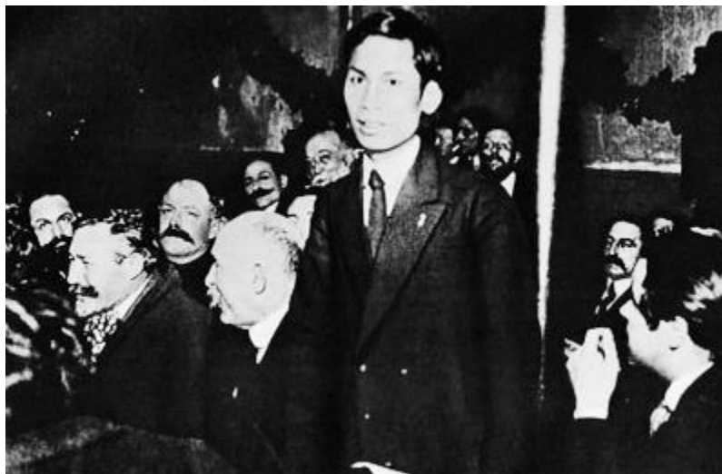
Hình ảnh Lãnh tụ Nguyễn Ái Quốc luôn gắn liền với lịch sử Ngành tuyên giáo của Đảng

Lịch sử Ngày truyền thống Ngành Tuyên giáo của Đảng gắn liền với quá trình ra đi tìm con đường cứu nước và truyền bá con đường cứu nước đó vào Việt Nam của Lãnh tụ Nguyễn Ái Quốc. Ngày 5 tháng 6 năm 1911, người thanh niên yêu nước Nguyễn Tất Thành đã rời Tổ quốc ra đi tìm đường cứu nước. Vượt qua sự hạn chế về tư tưởng cứu nước của các sĩ phu yêu nước và các nhà cách mạng có xu hướng tư sản đương thời, Nguyễn Ái Quốc đã đến với chủ nghĩa Mác-Lênin, mà sự kiện có ý nghĩa quyết định chính là khi Người đọc được Sơ thảo lần thứ nhất những luận cương về vấn đề dân tộc và vấn đề thuộc địa của Lênin đăng toàn văn trên báo Nhân đạo ngày 16 và 17-7-1920. Từ đó, Người ra sức truyền bá con đường cứu nước vào Việt Nam. Công tác tuyên truyền được Nguyễn Ái Quốc và các chiến sĩ cách mạng tiên bối trực tiếp tiến hành bằng các hình thức in ấn, xuất bản, phát hành tài liệu, sách, báo, truyền đơn, tổ chức lớp huấn luyện cán bộ... Đồng thời, các tổ chức cách mạng tiền thân của Đảng Cộng sản Việt Nam cũng đã lập ra những bộ phận chuyên phụ trách công tác tuyên truyền như Ban Huấn luyện, Bộ Tuyên truyền.